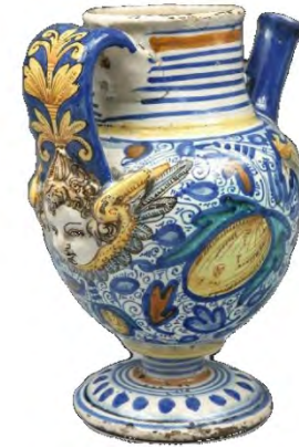
Anonyme (Montpellier), Chevrette , 4 e quart du 16 e siècle – 1 er quart du 17 e siècle, faïence stannifère, décor de grand feu polychrome