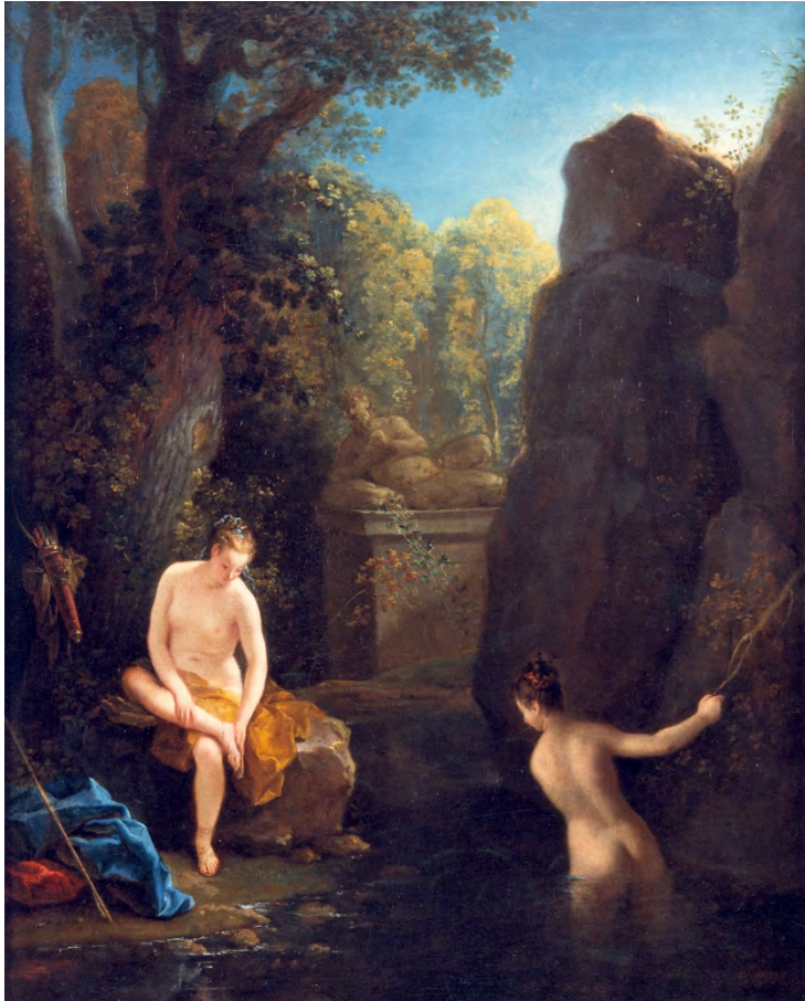
Jean Raoux, Diane au bain , vers 1721, huile sur toile, 80,5 x 65 cm