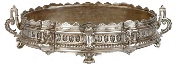
Maison Puiforcat, Jardinière de table, 4 e quart du 19 e siècle, bronze argentifère