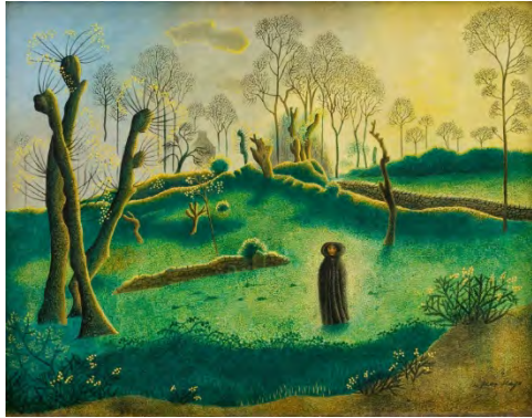
Jean Hugo, Le mois de Marie (Apparition) , vers 1933, huile et jaune d'œuf sur toile, 27,5 x 37,5 cm © ADAGP, 2025