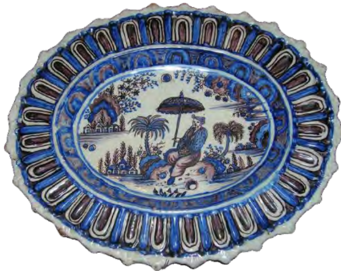
Faïencier anonyme (Montpellier, Saint-Jean-du-Désert, Marseille), Plat à ailes godronnées, décor au Chinois, 4 e quart du 17 e siècle, faïence stannifère, décor de grand feu en camaïeu bleu et manganèse