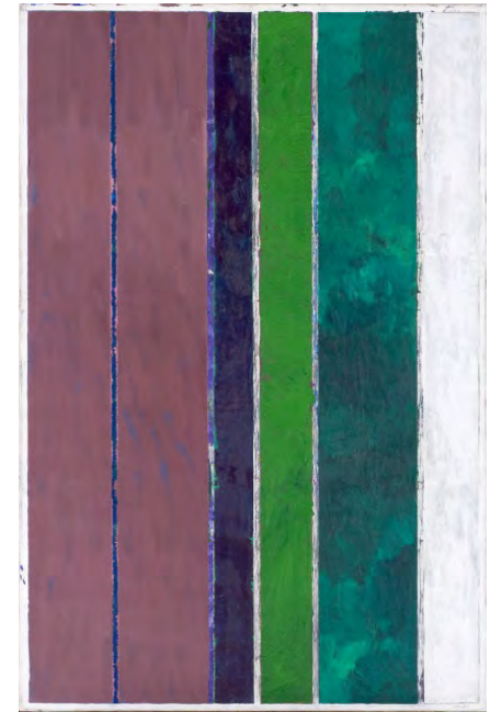
Vincent Bioulès, Bandes verticales II , 1974, acrylique sur toile, 195 x 130 cm © ADAGP, 2025