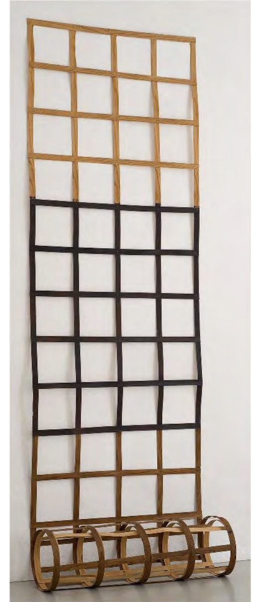
Daniel Dezeuze, Echelle , 1975, bois et brou de noix, 580 x 110 cm © ADAGP, 2025