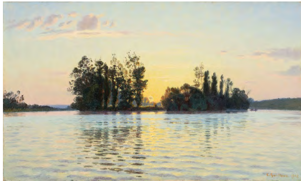
Charles Guilloux, Coucher de soleil sur l'île d'Herblay , 1902, huile sur toile, 33 x 55 cm