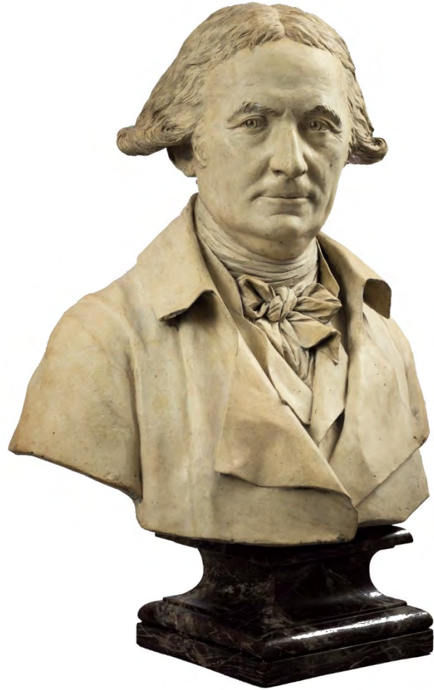
Etienne d'Antoine, Buste d'homme, 1790 – 1800, terre cuite, 50 x 50 cm