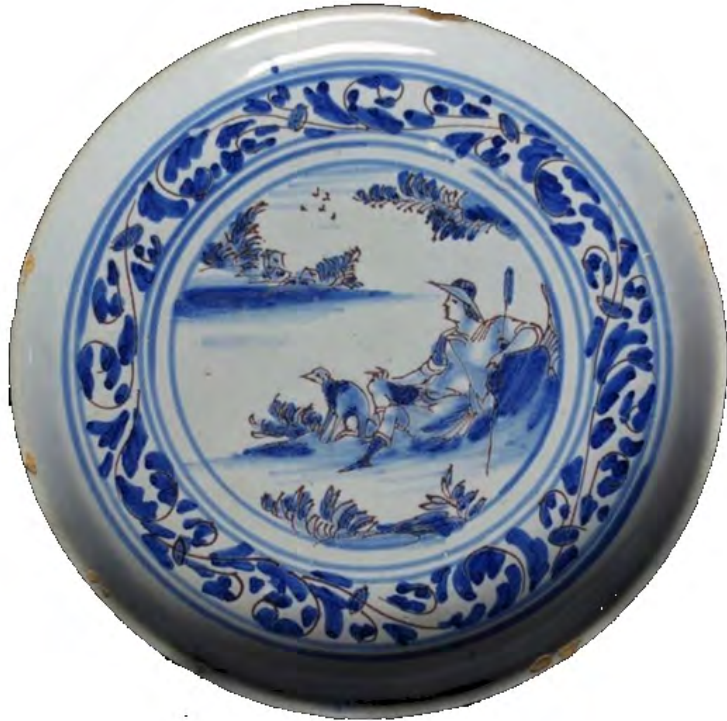
Anonyme (Nevers), Assiette , 17 e siècle, faïence stannifère, décor de grand feu à la manière de l'Astrée, camaïeu bleu