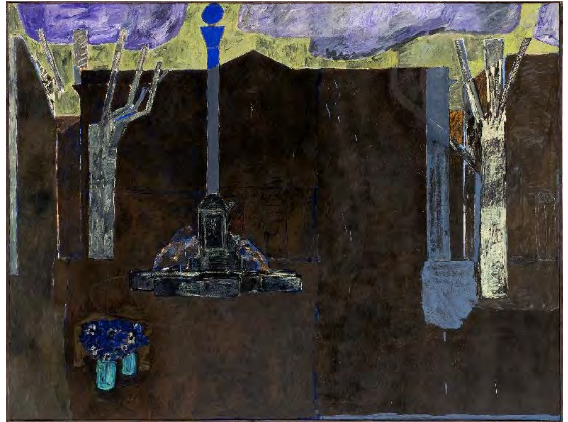
Vincent Bioulès, Tombeau d'Aix-en-Provence , 1977, huile sur toile, 190 x 250 cm