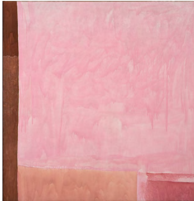
Vincent Bioulès, Grand espace rose I , 1969, laque glycérophthalique sur toile, 195 x 189,5 cm © ADAGP, 2025