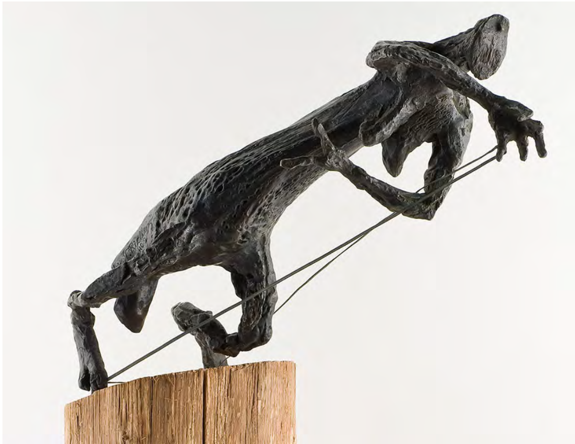
Germaine Richier, L'araignée I , 1946, bronze patiné, socle en bois, 30 x 46 x 23 cm (sans le socle) © ADAGP, 2025