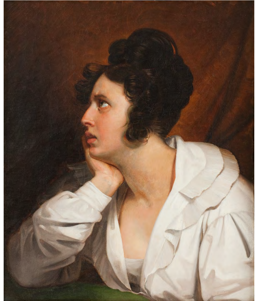
Claude-Marie Dubufe, L'inquiète (Etude) , vers 1831, huile sur toile, 65 x 54 cm