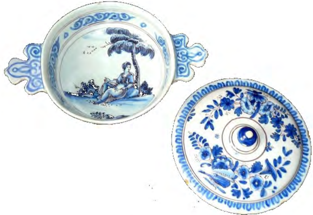
Anonyme (Nevers), bol à oreilles couvert, 18 e siècle, faïence stannifère, décor de grand feu, camaïeu bleu