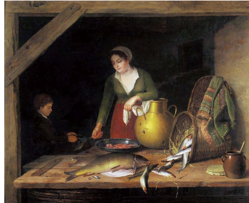
Jenny Legrand, Une mère préparant un repas de poissons , 1814, huile sur panneau, 45,5 x 55,5 cm