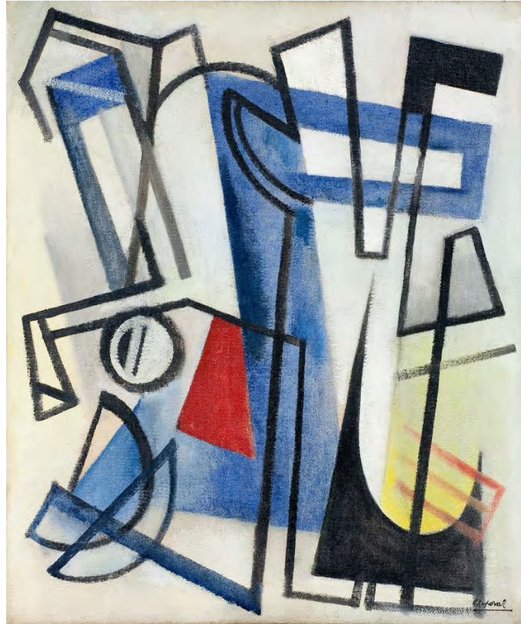
Youla Chapoval, Composition aux lignes noires , 1949, huile sur toile, 55 x 46 cm