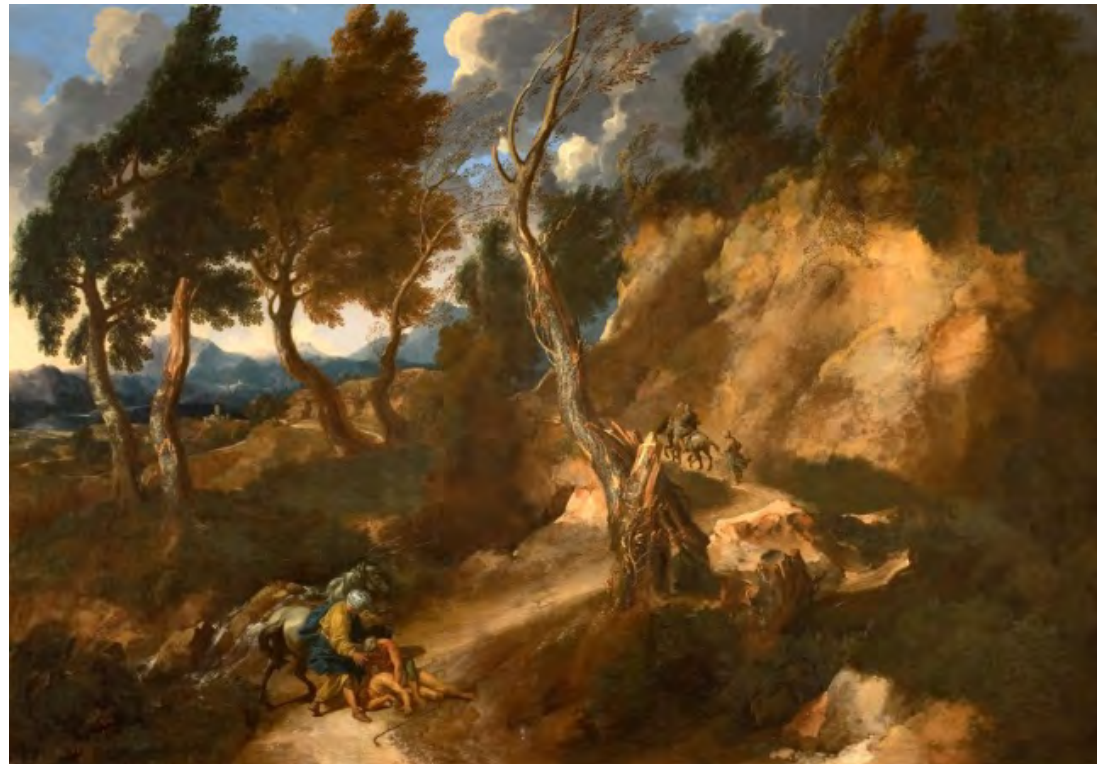
Gaspard Dughet, Paysage au bon samaritain , vers 1638, huile sur toile, 119 x 171 cm