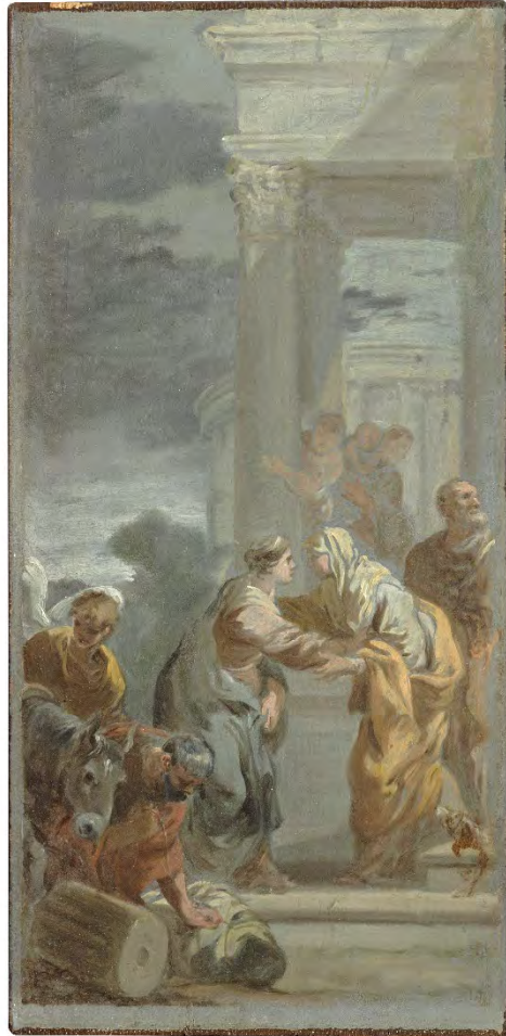
Sebastien Bourdon, La Visitation ( esquisse ), vers 1640, huile sur panneau, 42 x 21 cm