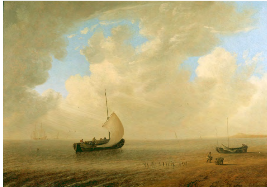
Willem Hermanszoon van Diest, Marine par temps calme , 1646, huile sur bois, 41 x 57,5 cm