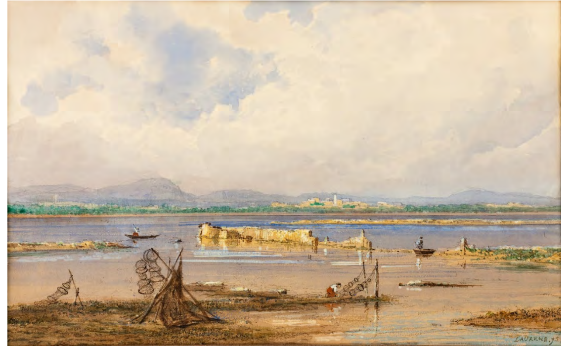
Jean-Joseph Bonaventure Laurens, Les étangs de Palavas , 1875, aquarelle, crayon graphite, rehauts de pierre noire, 33 x 52 cm