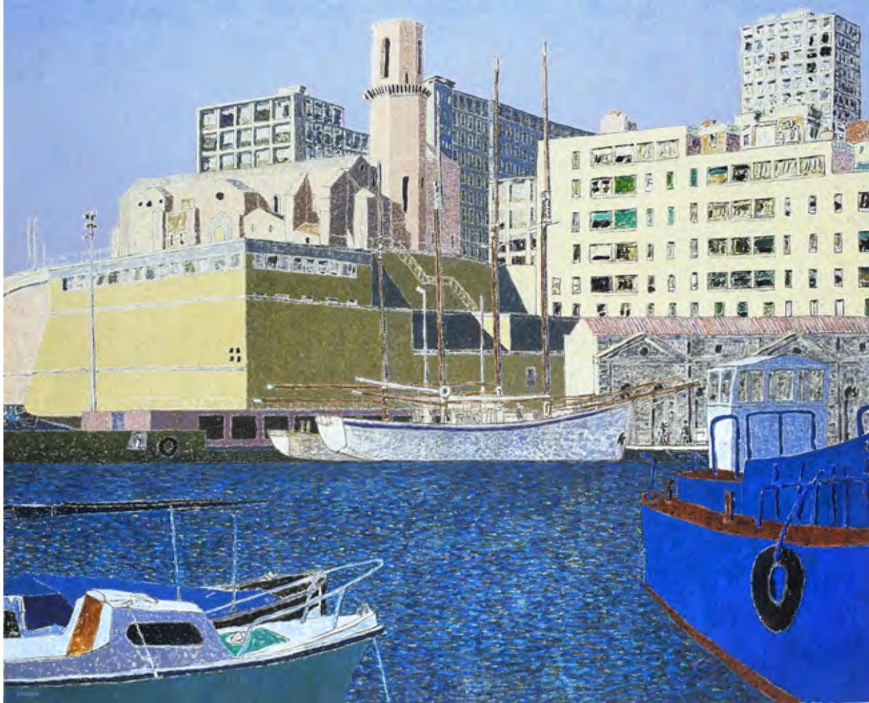
Vincent Bioulès, La Tourette II , vers 1994 – 1995, huile sur toile, 130 x 162 cm © ADAGP, 2025