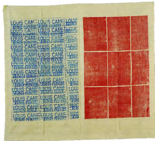
Louis Cane, Tampons , 1967, huile sur toile libre, 77,5 x 131 cm © ADAGP, 2025