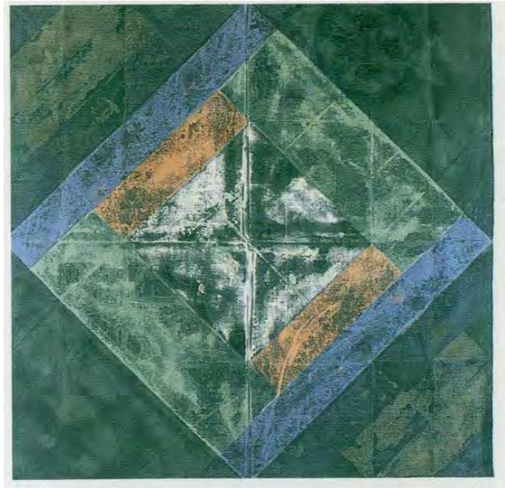
André-Pierre Arnal, sans titre , 1972, huile sur toile, 217 x 213 cm © ADAGP, 2025