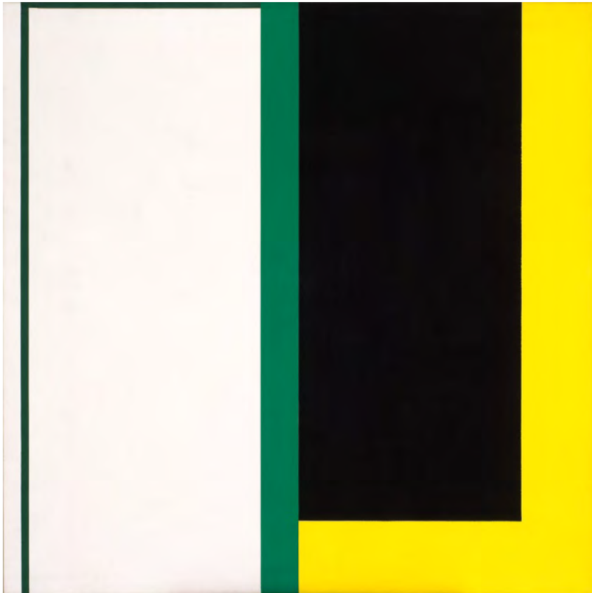
Marc Devade, sans titre , vers 1969, Acrylique sur toile, 200 x 200 cm © ADAGP, 2025