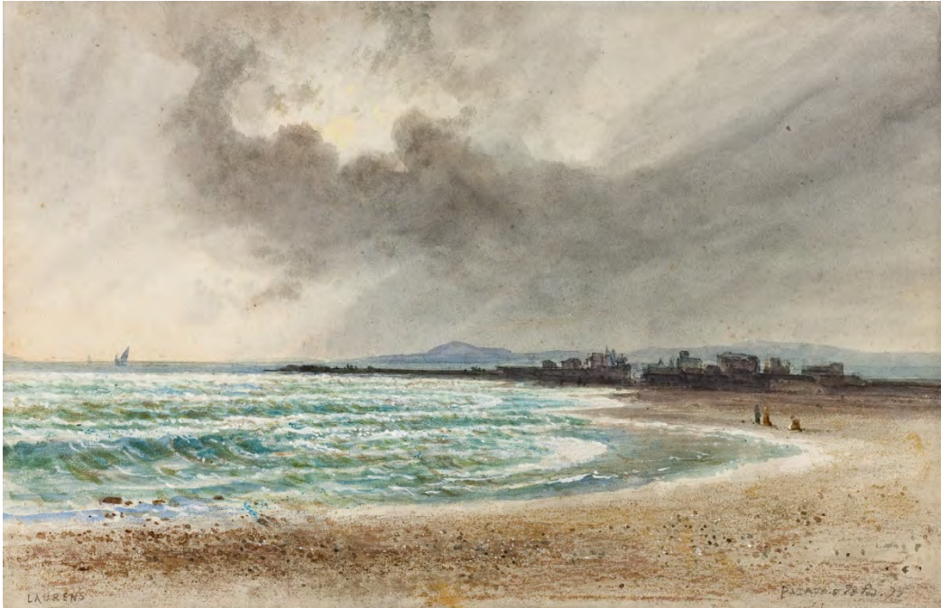
Jean-Joseph Bonaventure Laurens, La plage de Palavas , 1875, aquarelle, 26,5 x 43,5 cm