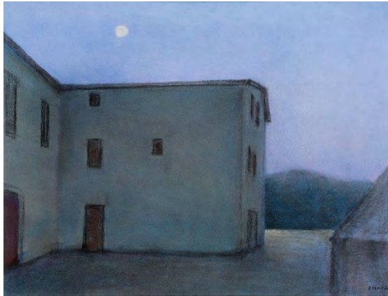
Jean-Pierre Blanche, Ferme n°1 , 2012, pastel sur papier, 50 x 65 cm