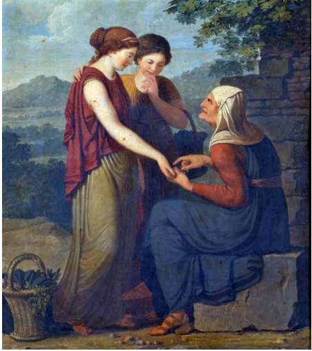
Benigne Gagneraux, La diseuse de bonne aventure , 1794, huile sur toile, 26,5 x 24 cm