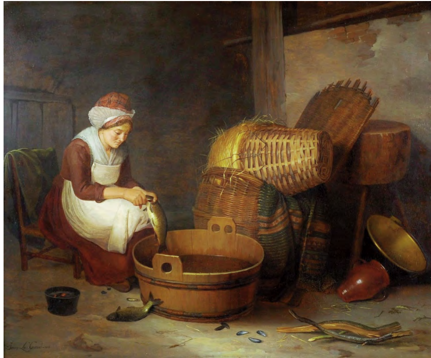
Jenny Legrand, La marchande de poissons , 1814, huile sur panneau, 45,5 x 55,5 cm