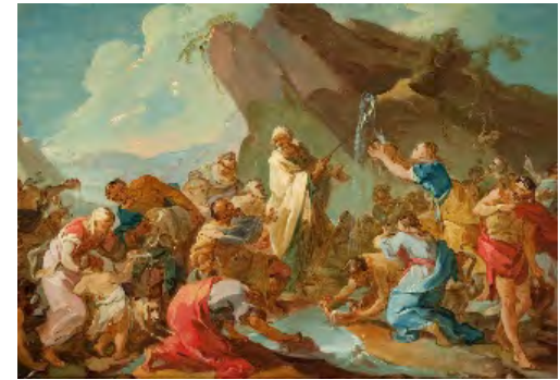
Joseph-Marie Vien, Le frapement du rocher , vers 1742, huile sur papier marouflé sur toile, 41 x 57,5 cm