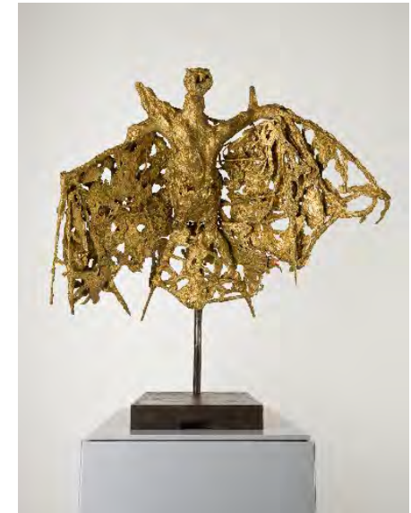
Germaine Richier, La chauve-souris , 1946, bronze naturel, 89,5 x 91 x 58 cm (avec socle) © ADAGP, 2025