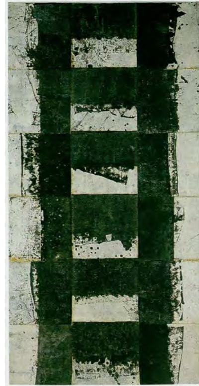
Jean-Pierre Pincemin, Support-surface , 1970, peinture sur toile libre, 264,5 x 133,5 cm © ADAGP, 2025