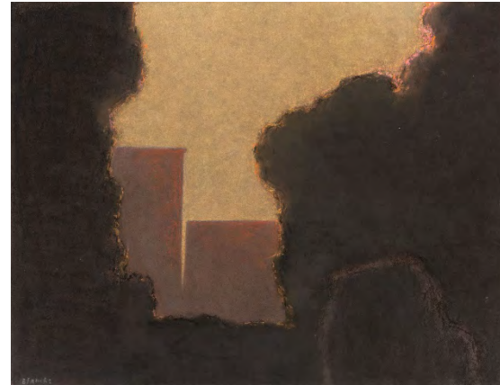
Jean-Pierre Blanche, Les grands arbres , 2013, pastel sur papier, 55,5 x 70,5 cm