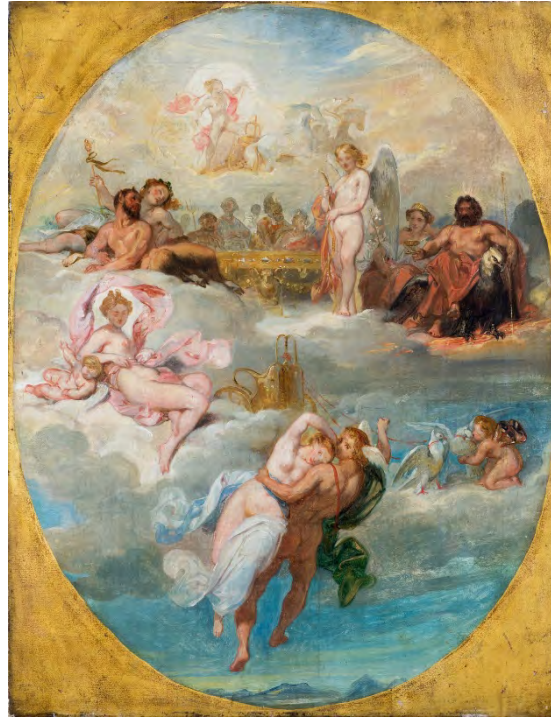
Eugène François Deveria, Psyché conduite à l'Olympe par Mercure pour épouser l'amour , 1839, huile sur toile, 65,3 x 50,3 cm