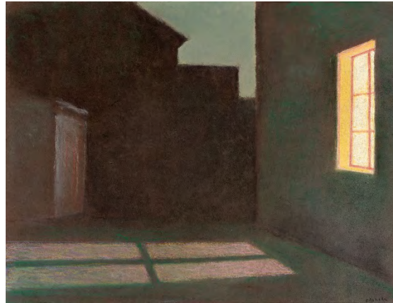
Jean-Pierre Blanche, La lumière de l'atelier , 2012, pastel sur papier, 59,5 x 73 cm