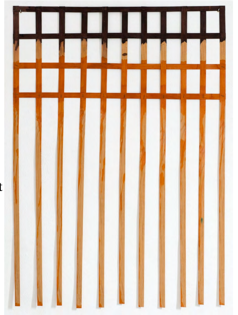
Daniel Dezeuse, Claie inachevée orange et brune , 1975, claie inachevée, bois de placage, teinture orange et brune, 131 x 96,5 cm © ADAGP, 2025