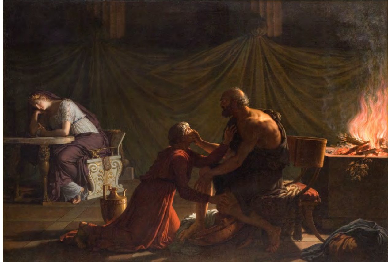
François-Xavier Fabre, Le retour d'Ulysse , 1799, huile sur toile, 100,5 x 146,5 cm