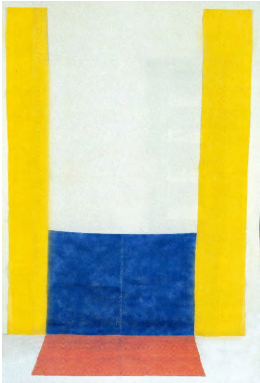
Louis Cane, Sol/mur , 1970, Acrylique sur toile libre, 235 x 180 cm (au mur), 83 x 107 cm (au sol) © ADAGP, 2025