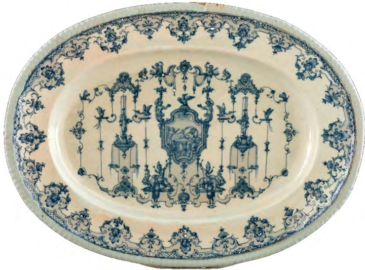
Manufacture Jacques Ollivier devenue Manufacture Royale, Plat, décor à la Bérain, 1 ère moitié du 18 e siècle, faïence stannifère, décor de grand feu en camaïeu bleu