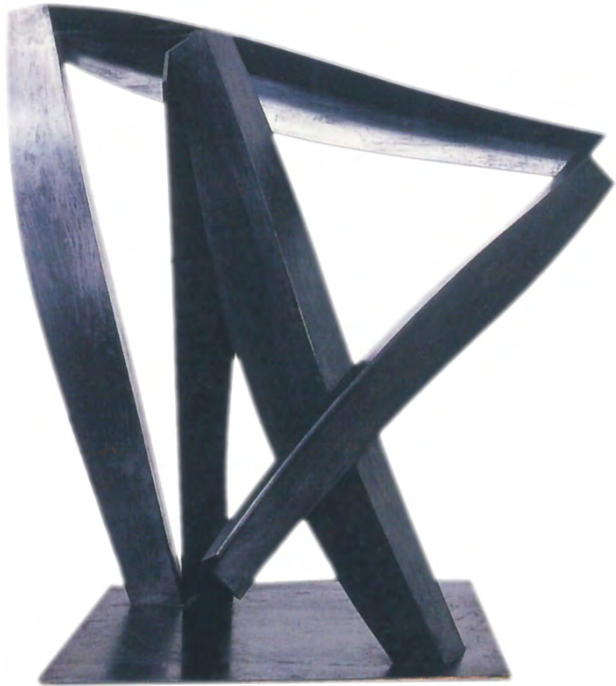
Alain Clément, sans titre , 2000, acier soudé, 103 x 117 x 77 cm