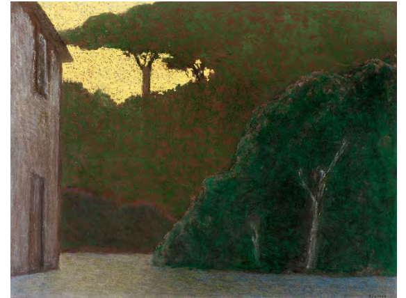
Jean-Pierre Blanche, Les abords , 2013, pastel sur papier, 54 x 69,5 cm