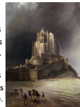
Théodore Gudin, Le Mont Saint-Michel sous l'orage, détail, 1830 ©Frédéric Jaulmes ©Musée Fabre Montpellier Méditerranée Métropole

Réservation obligatoire à contact.museefabre@montpellier.fr