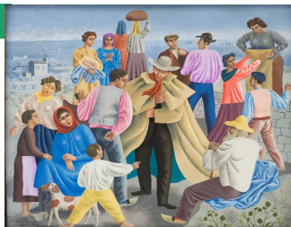
Jean HUGO, L'Imposteur, détail, 1931 © Photo Frédéric Jaulmes © Musée Fabre Montpellier3M

Dans la limite de 25 personnes, rdv dans le hall du musée.